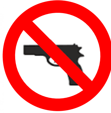
WAFFEN ALLER ART