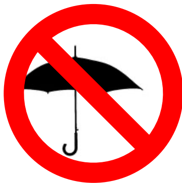
REGENSCHIRME (AUSGENOMMEN KNIRPSE)