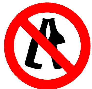
GLASFLASCHEN (am Center Court, Match Court 1 & auf allen Tribünen)